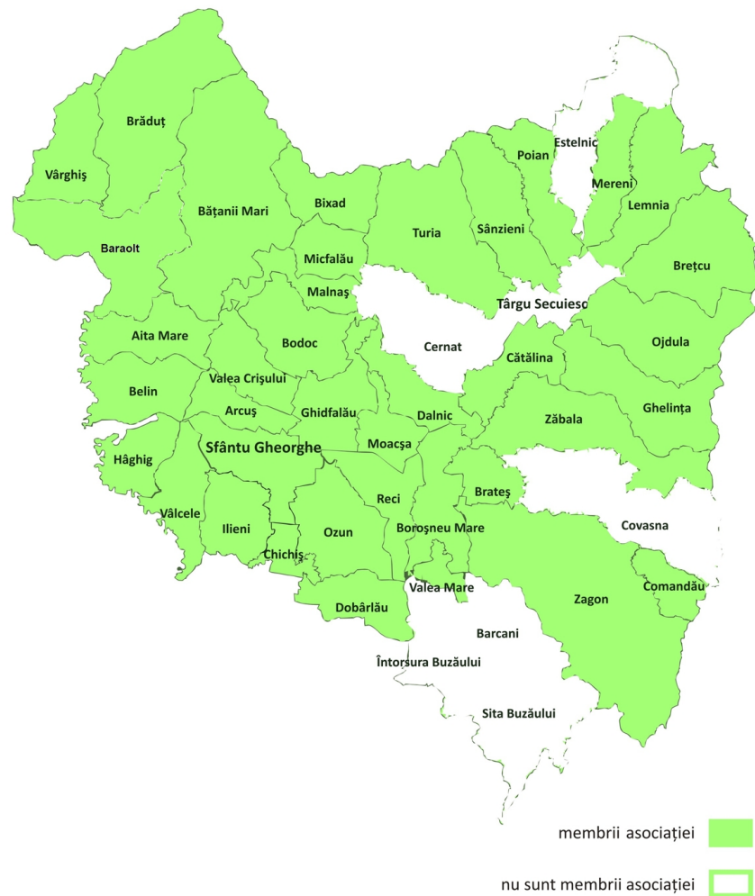
Fig.1 Harta localităților membre "ECO SEPSI"

Colectarea și valorificarea deșeurilor reciclabile in localitățile membre "ECO SEPSI", comparativ cu datele statistice EUROSTAT ale altor state membre este primară bazată pe o tehnologie nerațională. Finalizarea procedurii de atribuire a licitației pentru administrarea CMID Borosneu Mare reprezintă o prioritate în cadrul acțiunii de extindere geografică și regionalizare, depozitul neconform din Sf. Gheorghe fiind închis în anul 2015 și depozitarea finală după această perioadă a fost realizată pe depozitul ecologic din Brașov.